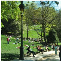
Công viên Buttes Chaumont

ng i chung v i các th c khách khác và tuyên b tôi có ăn th đó r i.