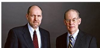
Hai tác giả: Stephen M. Walt, trái, và John J. Mearsheimer.

Những học giả gốc Do Thái tham gia vào các viện nghiên cứu chiến lược, đã liên tục đưa ra lập luận lý giải cho vai trò đóng góp minh chứng của Do Thái: trong chiến tranh lạnh – nhằm chấm dứt động viên ảnh hưởng của Liên Xô vào khu vực Trung Đông – và kéo dài đến sau bình cục 11-2001 - vì Do Thái và Hoa Kỳ cùng bị đe dọa bởi phong trào khủng bố Hồi Giáo cực đoan. Họ còn liên tục nhấn mạnh rằng Do Thái là nước duy nhất ở Trung Đông có truyền thống do, dân chủ và cùng chung chia sẻ những giá trị nhân bản với Hoa Kỳ.