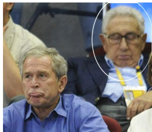
Henry Kissinger đang ngu g t

“Kissinger i Paris v ngày 14-12-1972 ông bàn v i Nixon sau đó g i i h u th cho Hà N i đ e d a n u BV không tr i bàn h i ngh trong 72 gi đ ng h (3 ngày)s đ a t i h u qu nghiêm tr ng. Cũng trong ngày Nixon ra i nh phong i a c ng H i Phòng b ng máy bay th mìn và cho B i i nh không quân nghiên c u k ho ch oanh i c trong g i h n 72 gi . Nixon i bác b i Kissinger khuyên T ng th ng lên truy n hình thông báo chí n đ ch, ông ra i nh cho Kissinger m cu c h p báo ngày 16-12 đ nói cho đ lu n bi t hòa đàm b i c vì BV ngoan c . Kissinger ám ch cho bi t chính ph s có bi n pháp m nh.”