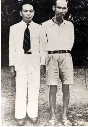
Võ Nguyên Giáp – Hồ Chí Minh

Ông viết: 12 ngày cửa trận dội bom Bức Việt (18-12 đến 30-12-1972) "là trận lớn nhất kể từ sau Thế chiến hai"