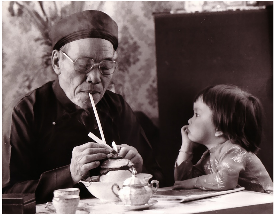
Cháu nhìn ông hút thuốc