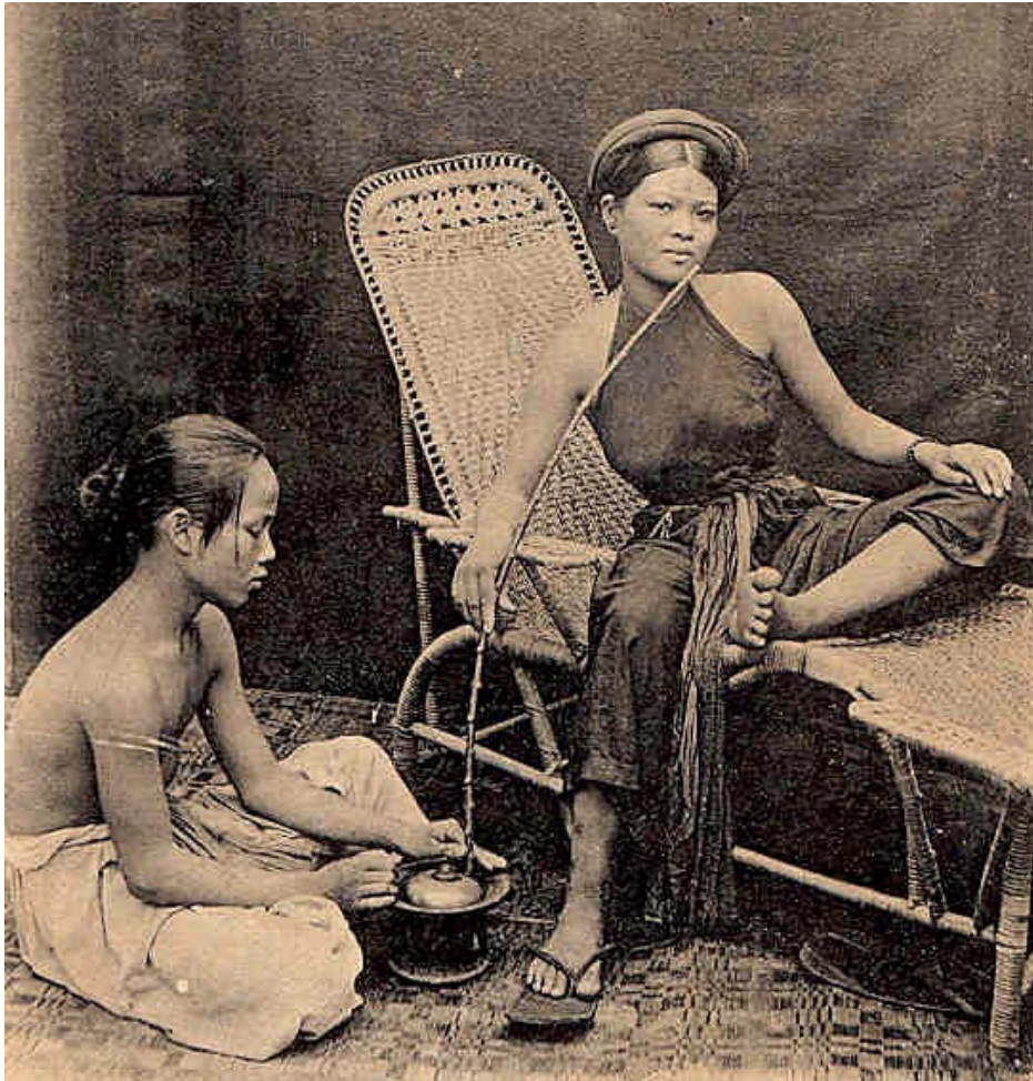
Đàn bà Vi t Nam hút thu c ào

Nh ai nh nh thu c ào, Đã chôn đ u xu ng, i ào đ u lên.