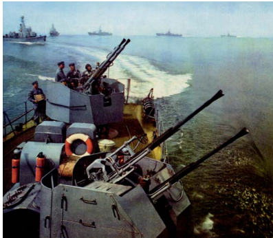
Biên đ i trên b n, b đ i tàu ch ng ng m c a h i quân ta