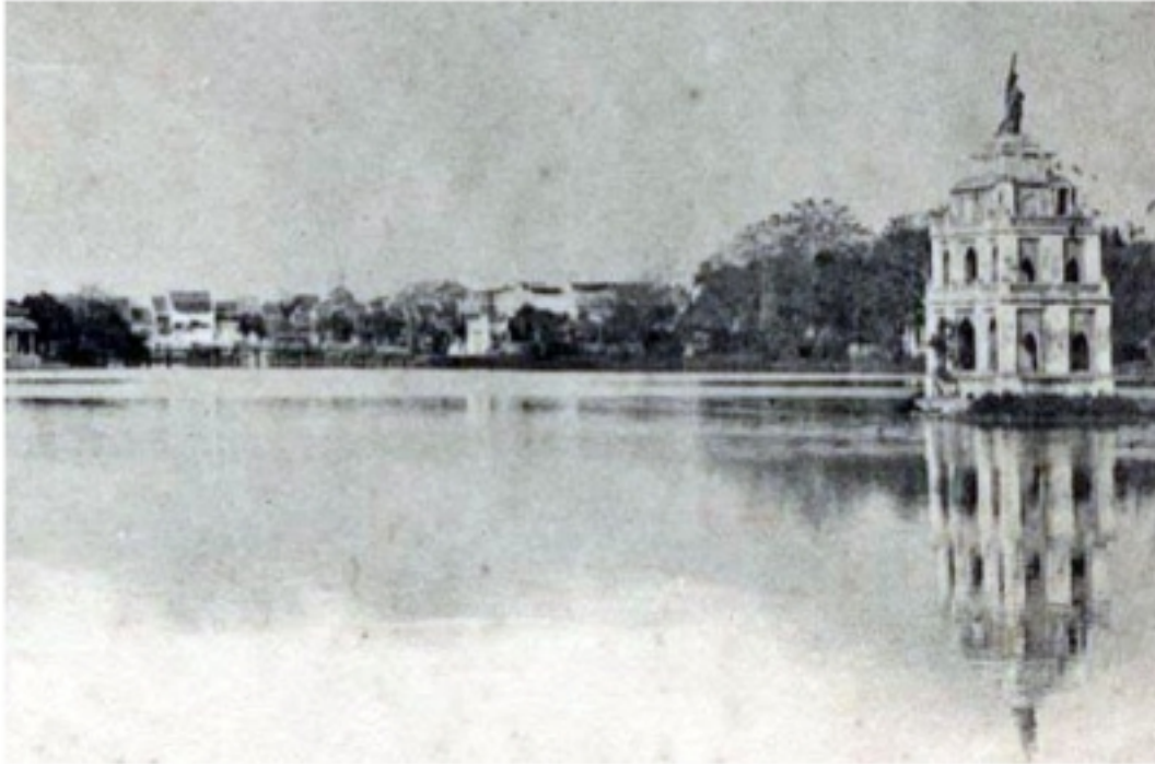
Tổn thất văn hóa trên nóc Tháp Rùa