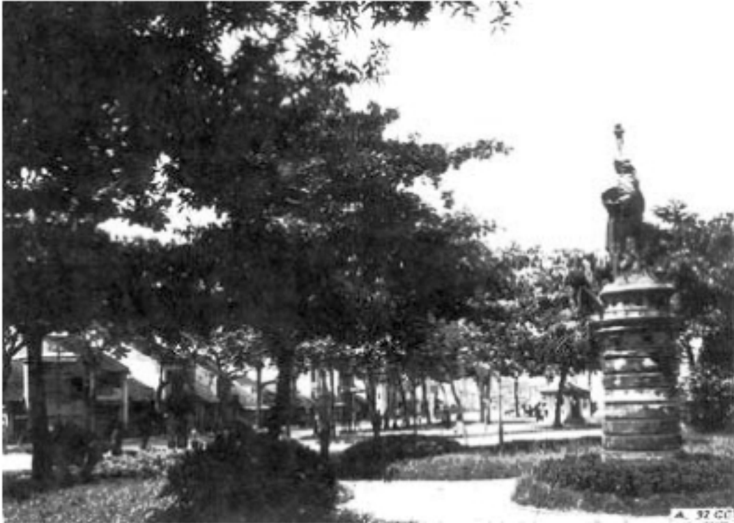
“Liberté sur le Pagodon du Petit - Lac à Hanoi”

Tài liệu gốc: Nguyễn Phúc Giác Hải Thư viện số, 14 Tháng 10 năm 2010 11:21