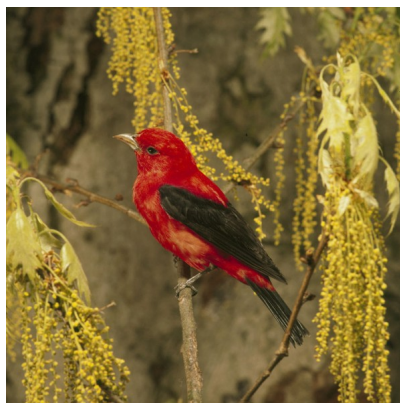
☐☐☐ Tanager Đ

Tanager đỏ t &#i là một loài chim biết hát có trung bình có trú ở Nam M. Trước đây, chúng được phân loại vào họ Thraupidae, nhưng ngày nay chúng và các loài lân cận được phân loại vào họ chim H&#ng y do giọng hát và bộ lông của chúng gần với những loài trong họ chim h&#ng y h&#n.