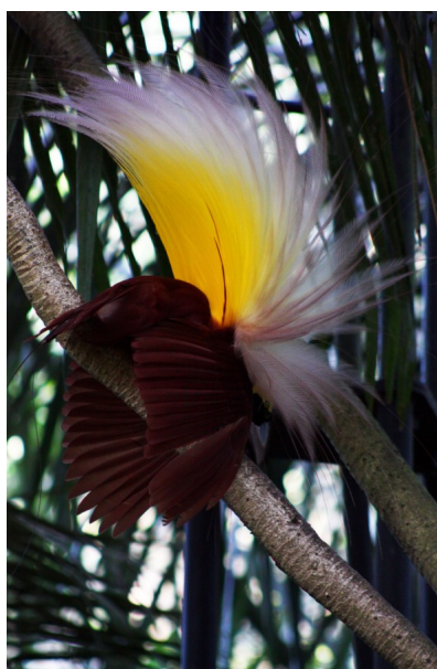
Chim Thiên Đ&#ng