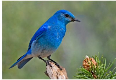
Chim Núi Xanh

Chim núi xanh là loài có kích cỡ trung bình khoảng 28g, dài 15–20 cm. Những con đực trưởng thành có màu xanh sáng, nh&#t đ&#n &#b&#ng. Những con cái trưởng thành có bộ lông xanh đậm hơn ở cánh và đuôi, lông xám ở ngực, cổ và lưng. Chim núi xanh là loài di cư. Chúng sống rải rác từ Mexico đến Alaska, xuyên suốt từ phía Tây Hoa Kỳ và Canada.