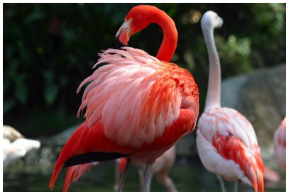
□□□□ H ng H c

H ng h c là loài chim l i n c s ng thành b y đàn. Chúng th ng t t p c các đ m, phá, n i có nhi u bùn, n c. Có 4 loài h ng h c ở Châu M và 2 loài ở C u Th Gi i. Màu lông c a h ng h c thay đ i tu theo loài, t h ng phai cho t i đ th m ho c đ son. M t đ i u đ c bi t n a loài này, mà cho đ n nay các nhà khoa h c v n ch a lý gi i đ c đó là chúng th ng ch đ ng trên m t chân.