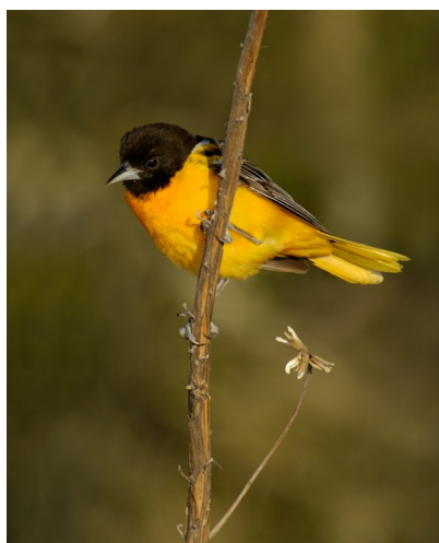
☐ Vàng Anh

Chim Vàng Anh Baltimore thường có dài 18cm và nặng 34 g. Chúng được gán cái tên Baltimore do màu lông của chúng con chim được giọng với màu áo khoác của chúng giống lính