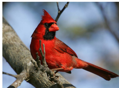
Chim Hồng Y

Chim Hồng y phía Bắc hay chim đỏ là loài chim sống ở Bắc Mỹ (Nam Canada, qua Đông Hoa Kỳ, từ Mexico tới Bắc Guatemala và Belize; và cả ở Đảo lớn Hawaii). Loài này thường sống trong rừng, vùng cây bụi và đầm lầy. Chúng có cái mỏ rất đặc biệt cùng với một kho&#ng lông giống như cái mũ trên mắt màu đen ở con đực và màu ghi ở con cái. Giống tính của loài này còn đặc biệt hơn trên bộ lông sống của chúng. Màu đỏ tươi rực rỡ là con đực, màu nâu đỏ đậm là con cái.