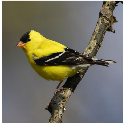
Kim T<#223; c

Kim t<#223; c M<#223; hay Kim t<#223; c phía Đông là một loài chim B<#223; c M<#223; thu<#223; c h<#223; nhà s<#223;. Kim t<#223; c là loài di trú, t<#223; Nam Canada đ<#223; n B<#223; c Carolina trong suốt mùa sinh s<#223;n, và t<#223; nam biên gi<#223; i Canada t<#223; i Mexico vào mùa đông. Kim t<#223; c là loài s<#223;ng c<#223;ng đ<#223;ng. Chúng t<#223; p h<#223; p l<#223; i v<#223; i nhau khi đi ki<#223; m m<#223; i và di c<#223;. Kim t<#223; c th<#223;ng s<#223;ng m<#223;t v<#223; m<#223;t ch<#223;ng, mùa sinh s<#223;n duy nh<#223;t trong năm c<#223;a chúng th<#223;ng b<#223;t đ<#223;u vào cu<#223; i tháng 7.