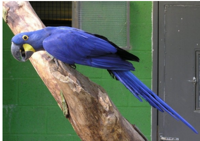
□□□□□□ □ V t Xanh Hyacinth

Có ngu n g c Trung và Đông Nam M , loài v t đuôi dài Hyacinth là loài v t l n nh t và cũng là loài v t bi t bay l n nh t trên th gi i. Trong khi loài này r t đ nh n ra b i b lông màu xanh tím b t m t, v t đuôi dài Hyacinth cũng r t đ b nh m v i loài v t tía Lear's, loài còn quý hi m h n nhi u.