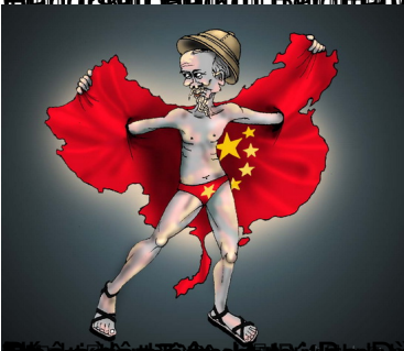
Trở lại m