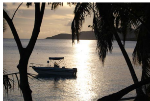
Đảo Isla Vieques, Puerto Rico

với phong cảnh tuyệt đẹp cùng các loài sinh vật quý hiếm.