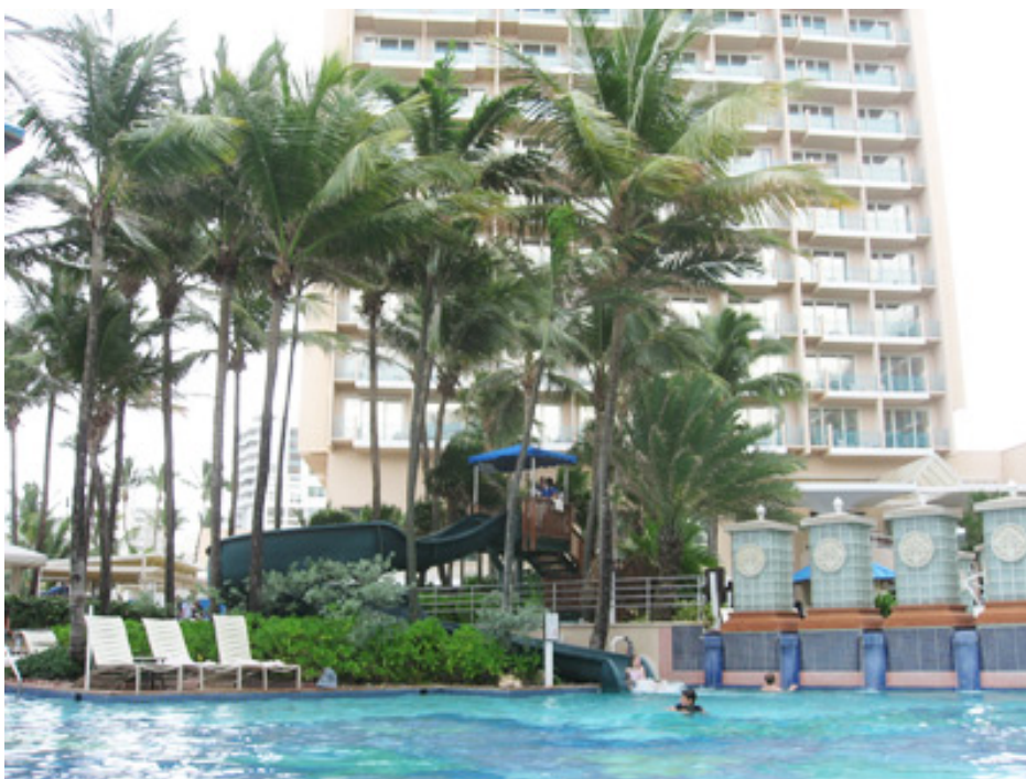
Bãi biển Condado - Puerto Rico nhìn từ phòng 26 khách sạn Marriott.

Vé tua công việc và vé máy bay từ Los Angeles chỉ trên dưới 1,000 đô cho chuyến đi trong vòng một tuần. Đừng quên thêm vài trăm để tham gia các tua phượt. Nhưng vẫn là vẫn là túi tiền trong thời gian kinh tế khó khăn hiện nay.