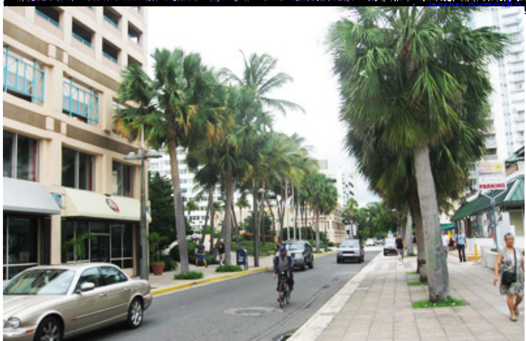
Trình chuyển du ngoạn miền Nam Caribbean.

Tiền xe taxi tối thiểu khoảng vỏ đây là 17 đô la. Du khách tối Mối cũng không cần đi tiền vì đô la Mối được chấp nhận khắp nơi trong vùng Caribbean. Tiếng Anh được sử dụng khắp nơi nên cũng dễ giao dịch. Một ngạc nhiên cho chúng tôi là khách sạn có phòng liền kề chúng tôi nghỉ ngơi sau một chuyến bay dài. Thông tin ít khi khách sạn có phòng trống 3 giờ trưa. Chỗ mùa