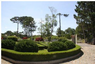
Góc Đà l&# t