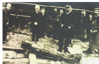
Án t̄ hình